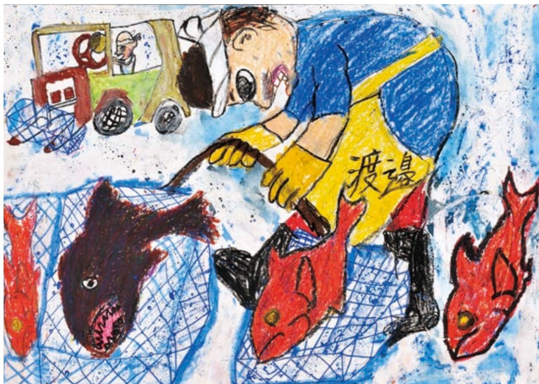
深海魚とキンメとくらべっこだ！