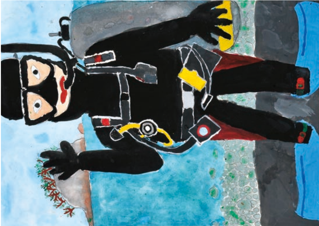
海の仕事ダイビング